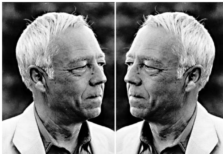
EL POETA ITALIANO LUCIANO ERBA (MILÁN, 1922-2010).

Luciano Erba nació en Milán el 18 de septiembre de 1922 y murió en su ciudad natal el 3 de agosto de 2010. Erba vivió siempre en la ciudad de Il Duomo, salvo algunos breves períodos que pasa en Suiza (durante la Segunda Guerra Mundial), en París y en los Estados Unidos. Se graduó en la Universidad Católica de Milán en 1947 en Lengua y Literatura Francesas. Tras trabajar en distintos institutos de enseñanza media, impartiría clases de Literatura Francesa y Literatura Comparada en la misma universidad donde se había graduado. Además de escribir poesía y crítica literaria, Erba tradujo a Blaise Cendrars, Henri Michaux o Francis Ponge.