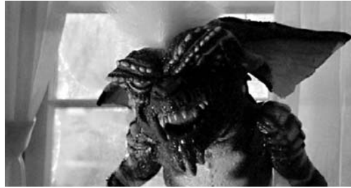
THE GREMLINS ES UNA PELÍCULA DIRIGIDA POR JOE DANTE QUE SE ESTRENÓ EN SALAS EN 1984.

Años más tarde investigué sobre el origen de la leyenda en la que se basaron los guionistas para crear la historia. Un gremlin es una criatura mitológica de naturaleza maléfica y popular en la tradición de países de habla inglesa. Los gremlins son capaces de sabotear maquinaria de todo tipo. Esta percepción popular de los gremlins proviene de un cuento contado entre los pilotos ingleses de la Royal Air Force de servicio en Oriente